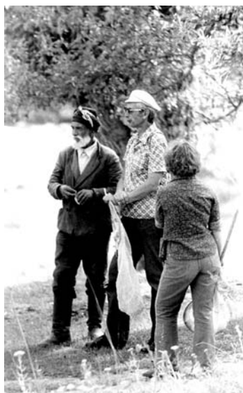
Экспедиция в Среднюю Азию, 1980-е годы