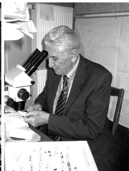
В гостях в ЗИНе, 1990-е годы