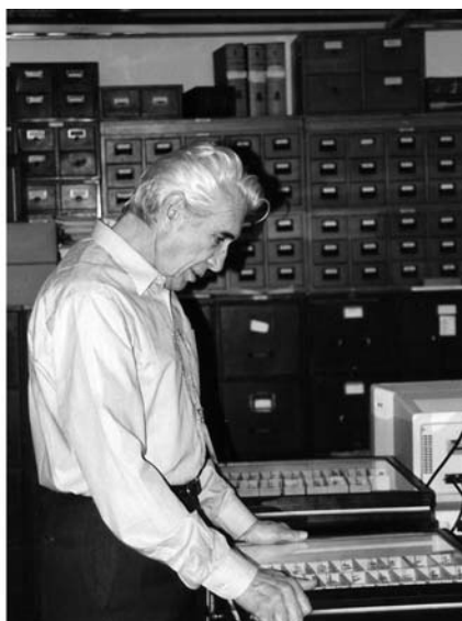
Работа в коллекциях Смитсоновского института (США, Вашингтон), 1990-е годы