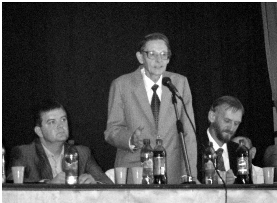
На 13 съезде РЭО (Краснодар, сентябрь 2007 г.)