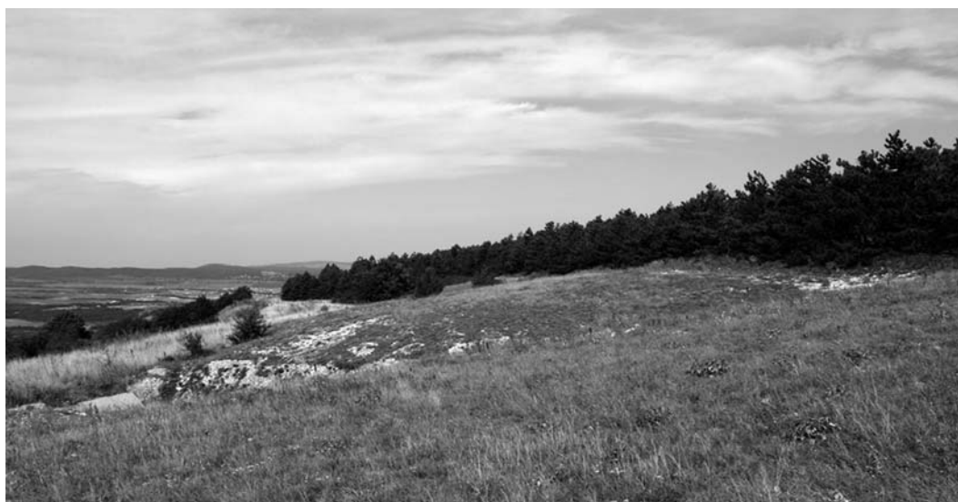
Рис. 3. Местообитание Phaeostigma notatum в окрестностях поселков Семигорье – Верхнебаканский. Горная ковыльно-асфоделиновая степь и лесные культуры сосны.

Жилкование передних крыльев у всех трех изученных экземпляров нетипичное для Phaeostigma notatum : между ветвями Rs только одна поперечная жилка (рис. 2: жилка rs1-rs2), а не две [см. Albarda, 1891: pl. 2, fig. 2c; Aspöck, 1986: fig. 2a]; т.е. «радиальных